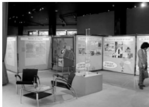
Vue générale de l'exposition à Strasbourg